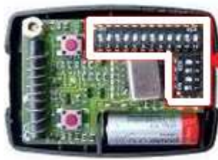
Télécommande V2 déjà programmée

Procédure de codage de la télécommande CARDIN lors du remplacement d'une télécommande V2 :