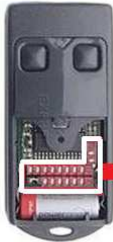
Télécommande CARDIN S738 TX2 ou TX4 à programmer